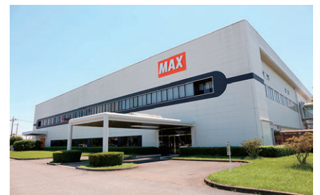
記載内容は取材時現在の情報です。