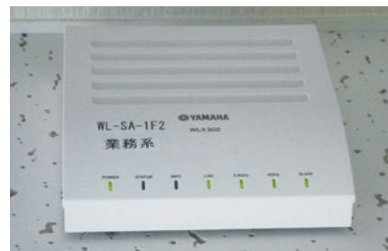
事務バックヤードエリアでの設置写真

伊勢志摩国立公園にある大自然の中で幅広い年齢層のお客様が様々な形で楽しみを満喫できるNEMU HOTEL & RESORT。近年は海外、特にアジアからも注目され、宿泊者も増えています。このような海外からのお客様からの強い要望のひとつに施設内でのWiFiサービスの提供がありました。