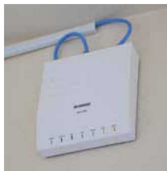
校舎内の廊下での設置写真

情報社会の中で生きる上で情報をどのように扱うかということは大きな問題です。多様な情報をどのようにやりとりしていくのか、茗溪の情報教育の本質はコミュニケーションにあります。コミュニケーション能力をつけるべく、130台を超える情報端末により教育活動を展開しています。