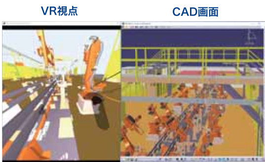
工場レイアウト内にVRで入り込み、実寸大で確認できる。接触判定、距離測定等を確認し、リアルタイムに修正可能。