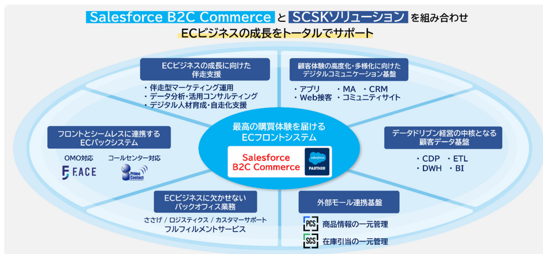
図:『Salesforce B2C Commerce 伴走支援サービス』の全体像

「Salesforce B2C Commerce伴走支援サービス」は、これまで培ってきたデジタルマーケティングの支援サービス、ECバックシステム、バックオフィス業務、顧客データ基盤、外部モールとの連携基盤まで組み合わせ、ECビジネスを総合的に支援するサービスです。