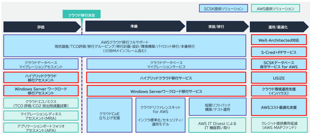
【図2:AWS ITトランスフォーメーションパッケージ for MCP SCSKクラウドリフト対応】