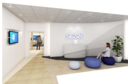
グループ総合受付