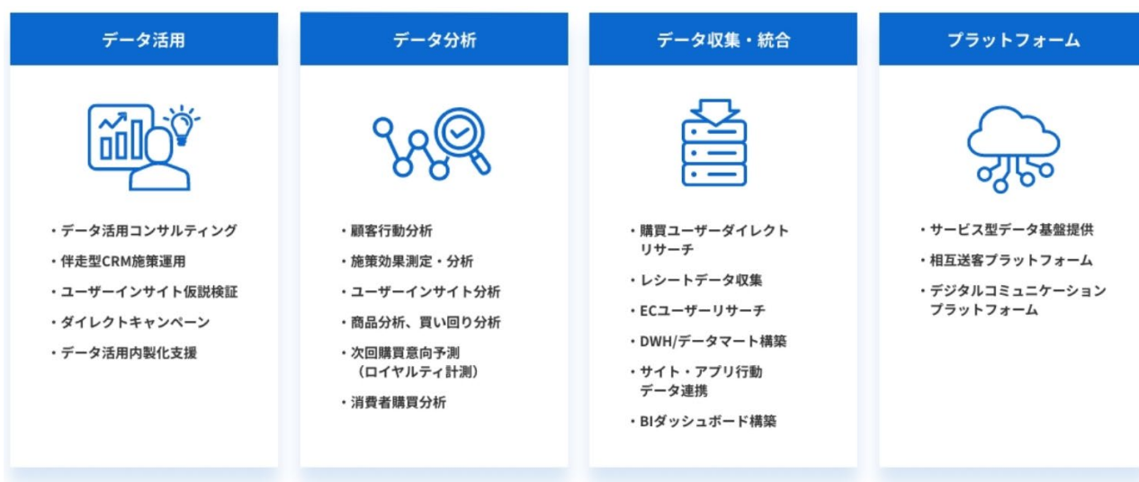
図:「data circle」のサービスメニュー

data circle は以下の4つのサービスを軸にお客様企業の収益向上・データドリブン経営の支援を行います。