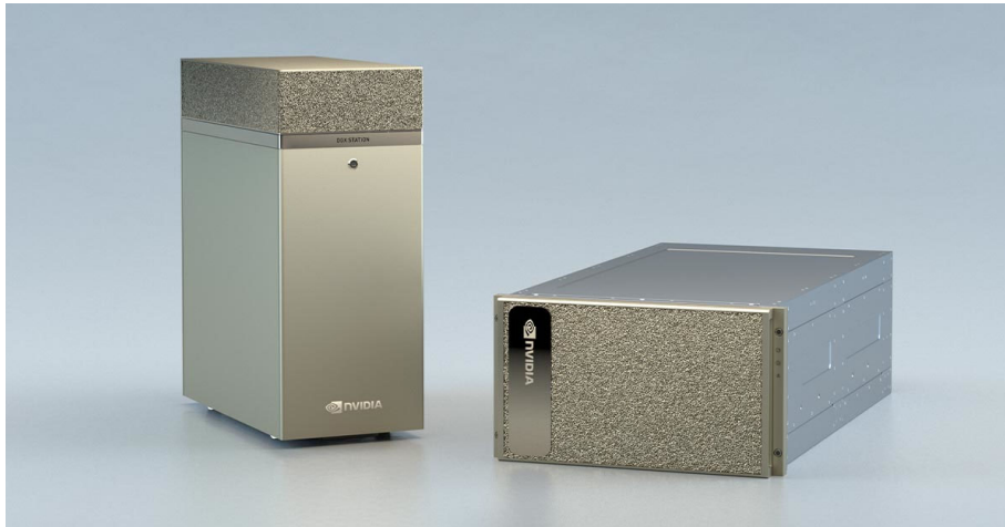
「NVIDIA DGX システム」