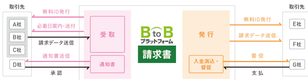
『BtoBプラットフォーム 請求書』利用イメージ

インフォマートが提供する「BtoBプラットフォーム 請求書」は、電子請求書のプラットフォームとして、「発行する請求書」だけでなく、「受け取る請求書」「支払金額の通知」など、多彩な請求業務の電子データ化に対応可能なクラウドサービスです。事前申請が必要ない「電子帳簿保存法」に対応可能なペーパーレス(ECO活動推進)と、コスト削減にもつながる仕組みとして、現在、全国約50万社にご利用いただいている電子請求書サービスです。