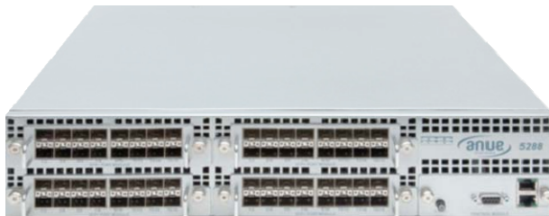
「Anue NTO」5288 モデル