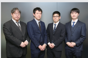
ITインフラサービス事業グループ クラウド事業本部 マルチクラウドインテグレーション部 第二課