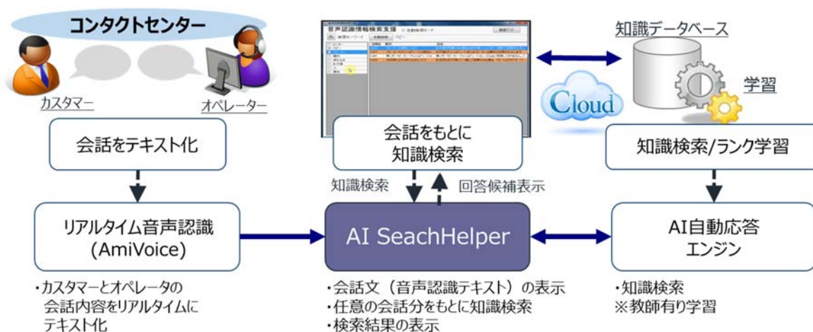
「VoIC AI SearchHelper」イメージ図

音声認識とAI自動応答エンジンを連携した音声FAQ検索ソリューションです。適切な回答情報をオペレーターにリアルタイムに提供することで、新オペレーターに負荷をかけない早期立ち上げや、お客様満足度の向上を実現します。また、従来と比較し、短期導入が可能です。