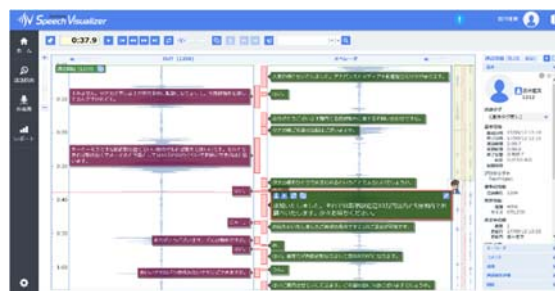
「AmiVoice Communication Suite」通話をリアルタイムにテキスト化

コールセンターで生まれる“声”をひとつのデータベースに集約し、さまざまな活用を可能にするソリューションです。お客様との会話をリアルタイムで文字化し、VOC分析や通話モニタリング、コンプライアンス対策にも活用することが可能です。会話の中で必ず述べなければいけない必須ワードやNGワード監視、音声キーワード検索等を行うことができるため、応対品質の向上にもつながります。