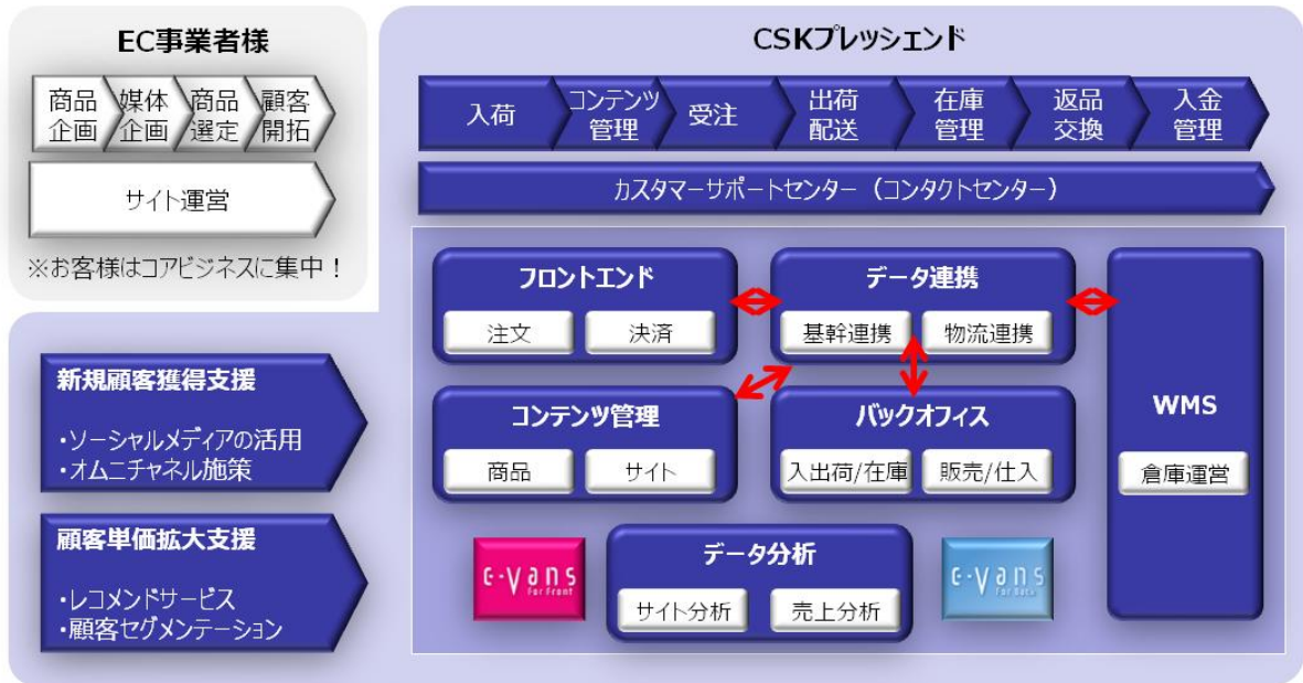
(ご参考) 利用型 EC システム「e-Vans」のシステム構成図